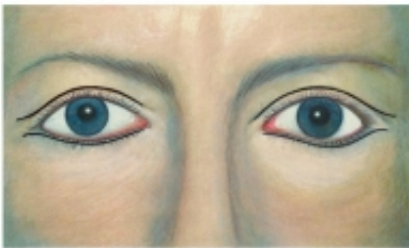
— Lidplastik - Narben, (mit freundlicher Genehmigung der ©DGPRÄEC)

Etwa 14 Tage vor der Lidplastik sollten Sie keine Schmerzmittel, wie z.B. Aspirin, einnehmen, da diese die Blutgerinnung verzögern. Auch auf Alkohol, Schlafmittel und Nikotin sollten Sie möglichst verzichten. Rechtzeitig vor der Lidstraffung sollte von Ihrem Hausarzt eine Bestimmung der Blutwerte erfolgen. Genaueres hierzu werde ich Ihnen beim Aufklärungsgespräch zur Operation mitteilen. Am Operationstag sollten Sie ungeschminkt und ausgeruht sein, sowie eine dunkle Sonnenbrille mitbringen. Darüber hinaus ist es empfehlenswert sich ein paar weiche Kühlelemente („Coolpacs“) zu besorgen.